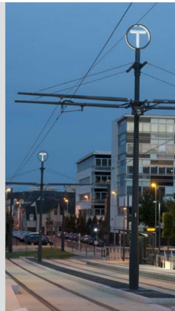
Tramway - Supports de L.A.C.