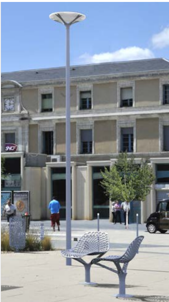
Eclairage et mobilier urbain