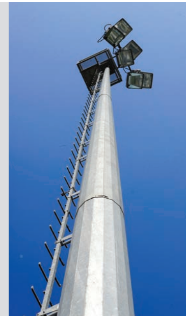
Mât grands espaces