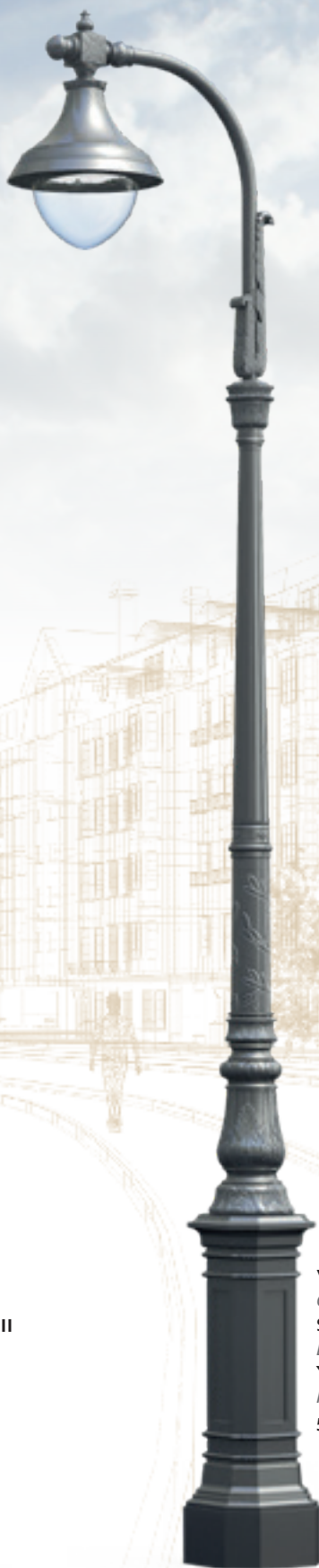
VENDOME II Crosse : Saint Germain I Luminaire : Ysalis C1 Hauteur : 5,60 m.