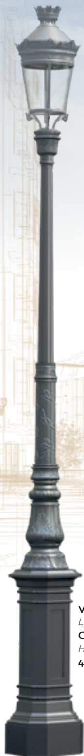
VENDOME I Luminaire : Chenonceaux III Hauteur : 4,63 m.