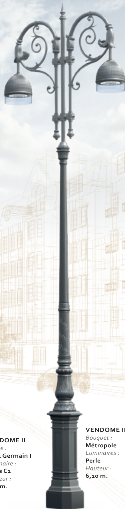
VENDOME II Bouquet : Métropole Luminaires : Perle Hauteur : 6,10 m.